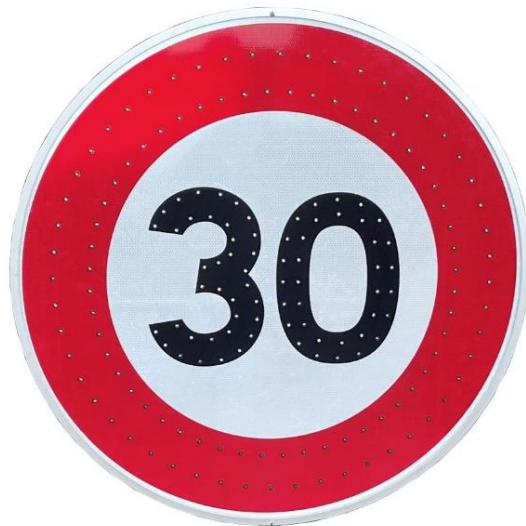
Diamètre 850 mm

Tous les types de panneaux sont réalisables !