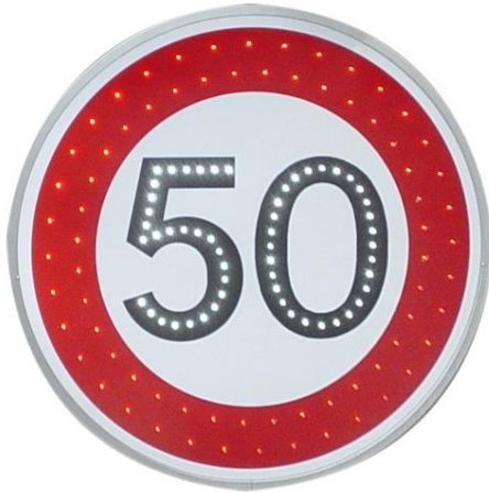
Diamètre 650 mm