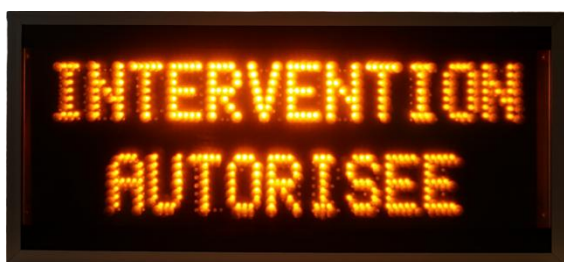
Allumé – Double symbole