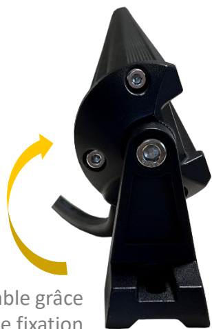
Rampe orientable grâce aux 2 pattes de fixation