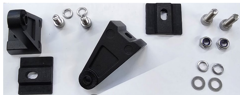
Pattes, cales en caoutchouc et visserie fournis