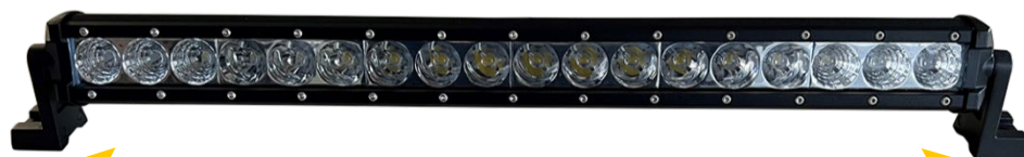
2 pattes de fixations à visser sur le pavillon du véhicule