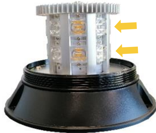
Classe 2 : 2 rangées de leds