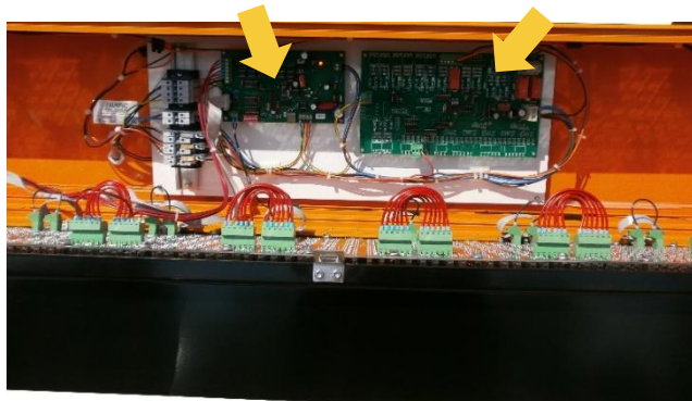
Carte de puissance