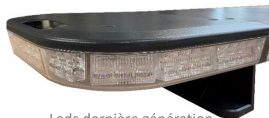
Leds dernière génération