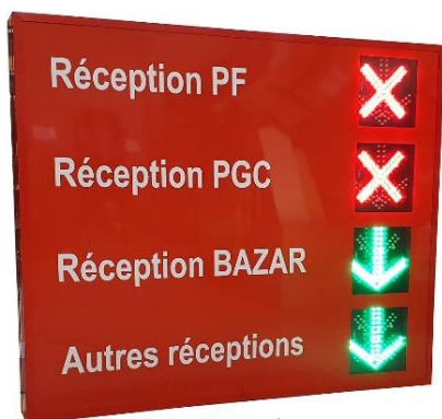
Intégration de Signaux Croix - flèche