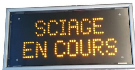
Caisson avec message fixe ou clignotant