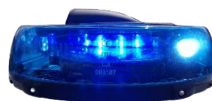
Variante avec feux latéraux