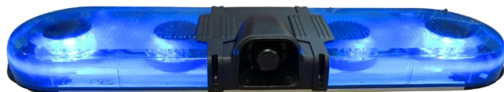
Variante avec cabochons bleus (251575B)