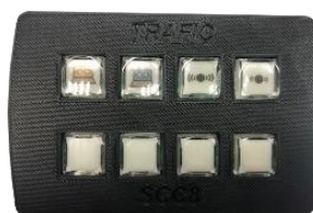
Boîtier 8 touches Ref 255325