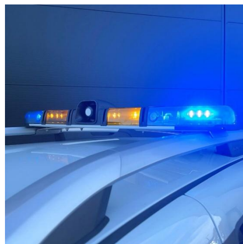
Rampe installée sur véhicule