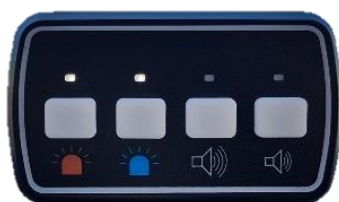
Boîtier 4 touches Ref 255643