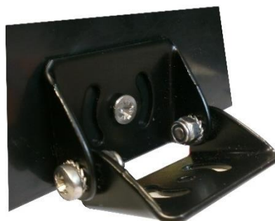
PATTE DE FIXATION