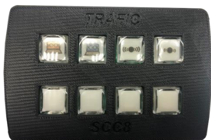
BOITIER FACE AVANT AVEC TOUCHE