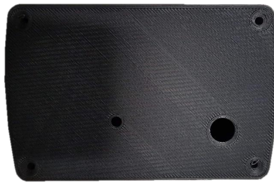
FACE ARRIERE BOITIER