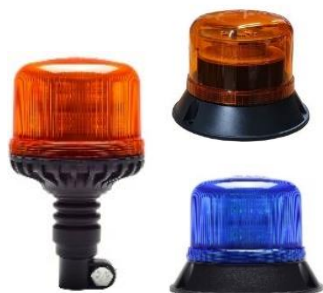
Gyrophare au choix