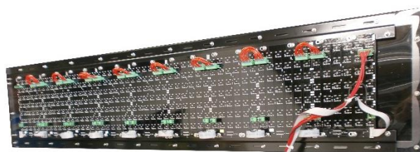
Carte d'affichage (vue arrière) pour un PMV 9 caractères