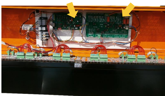
Carte de puissance