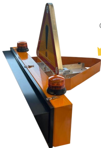
Carter aluminium pour Triflash